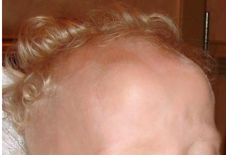
La alopecia bi-temporal en un niño con SPK