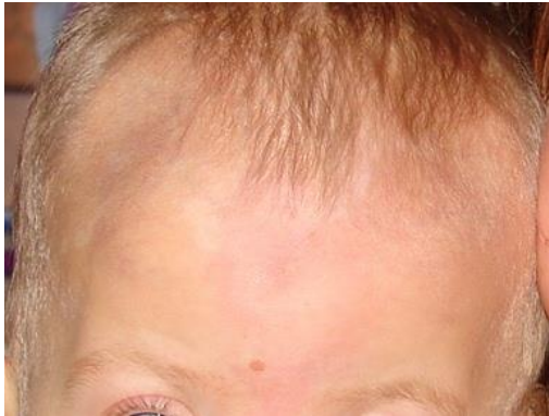
La hinchazón en la frente de un niño con SPK