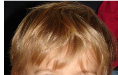
El modelo de pelo en un niño típico