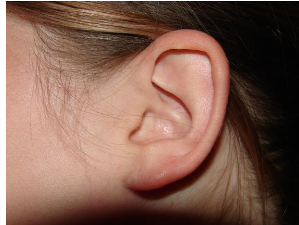
La oreja típica